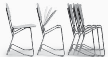
Klappmechanismus und Stapelung

Massive Rundstangen ( \varnothing 15 mm) mit einer korrosionsfesten Alu-Legierung farblos eloxiert.