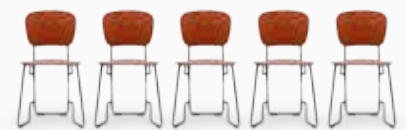
Farb- und Materialvielfalt

Fünffach verleimtes Sperrholz, Buche furniert